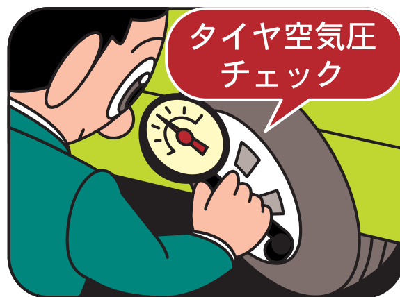
タイヤのエアバルブ（空気入れ）のキャップを外し、そこにタイヤゲージの口金を入れて測定します。